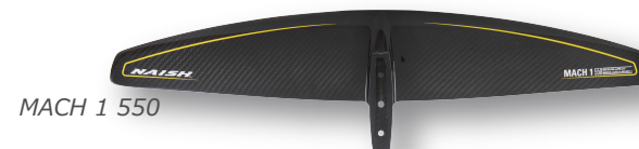
MACH 1 550