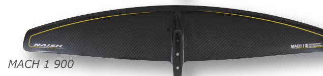
MACH 1 900