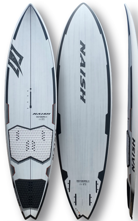
Ho'okipa Quad 84

シングルコンケーブのノーズエントリーエリアから、ダブルコンケーブのミッドセクションへと変化している。ミッドセクションはストレートなスクープ・ロッカーラインとなりレールのカーブを保ちながら、直線的なスクープロッカーラインを生み出す。このアットセンターラインがスピードとプレーニングパワーを生み出す。レールはノーズのソフトエッジから始まり、ミッドセクションを経てテールセクションではサーフボードスタイルのシャープなリリースへと変化する。このレールデザインにより、チョッピーなボトムターンでもトップターンではクリーンなリリースを提供する。